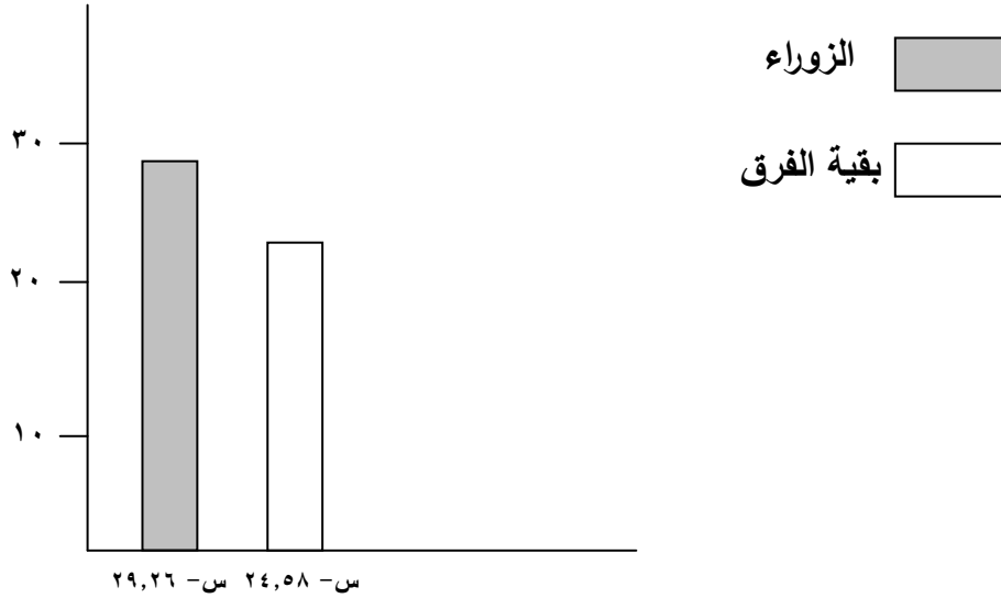
شكل رقم (٢)

٣٠ وهنا لابد من الإشارة الى أن أفضل فرق العالم مثل أندية (برشلونة وريال مدريد) الاسبانيين يستخدمون مبدأ امتلاك أو حيازة الكرة لأطول فترة ممكنة أثناء المباراة ، وتشير التقارير أن وقت امتلاك الكرة لنادي برشلونة بلغ (من ٣٥ – ٤٠ دقيقة) (**)(*) تقريباً على مدى شوطي المباراة ، مما يدل على أهميتها في لعبة كرة القدم ، وبالتالي إحراز الأهداف وخلق الفراغات والاستثمار الأمثل للوقت أثناء المباراة .